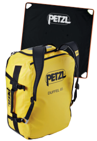
DUFFEL BAG 65 I Rucksack + Seilplane