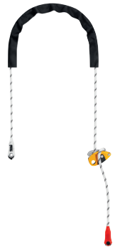
GRILLON 2 m längenverstellbares Verbindungsmitel