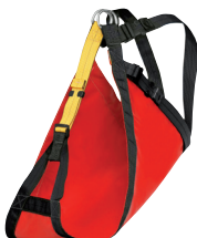
PITAGOR Rettungsdreieck Art.-Nr.: C80 BR

Optional, nicht im Preis inbegriffen, seperat bestellen: