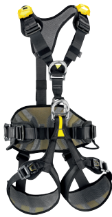
AVAO BOD FAST Auffang- + Haltegurt